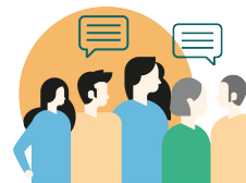
TABLA IDEAS CLAVES